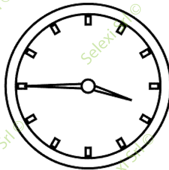
IMMAGINE SY 75

44 Rispondere al seguente quesito facendo riferimento all'IMMAGINE SY 75